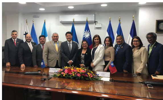
El Embajador Cheng visita a la presidenta y diputados del PARLACEN para fortalecer relaciones diplomáticas.